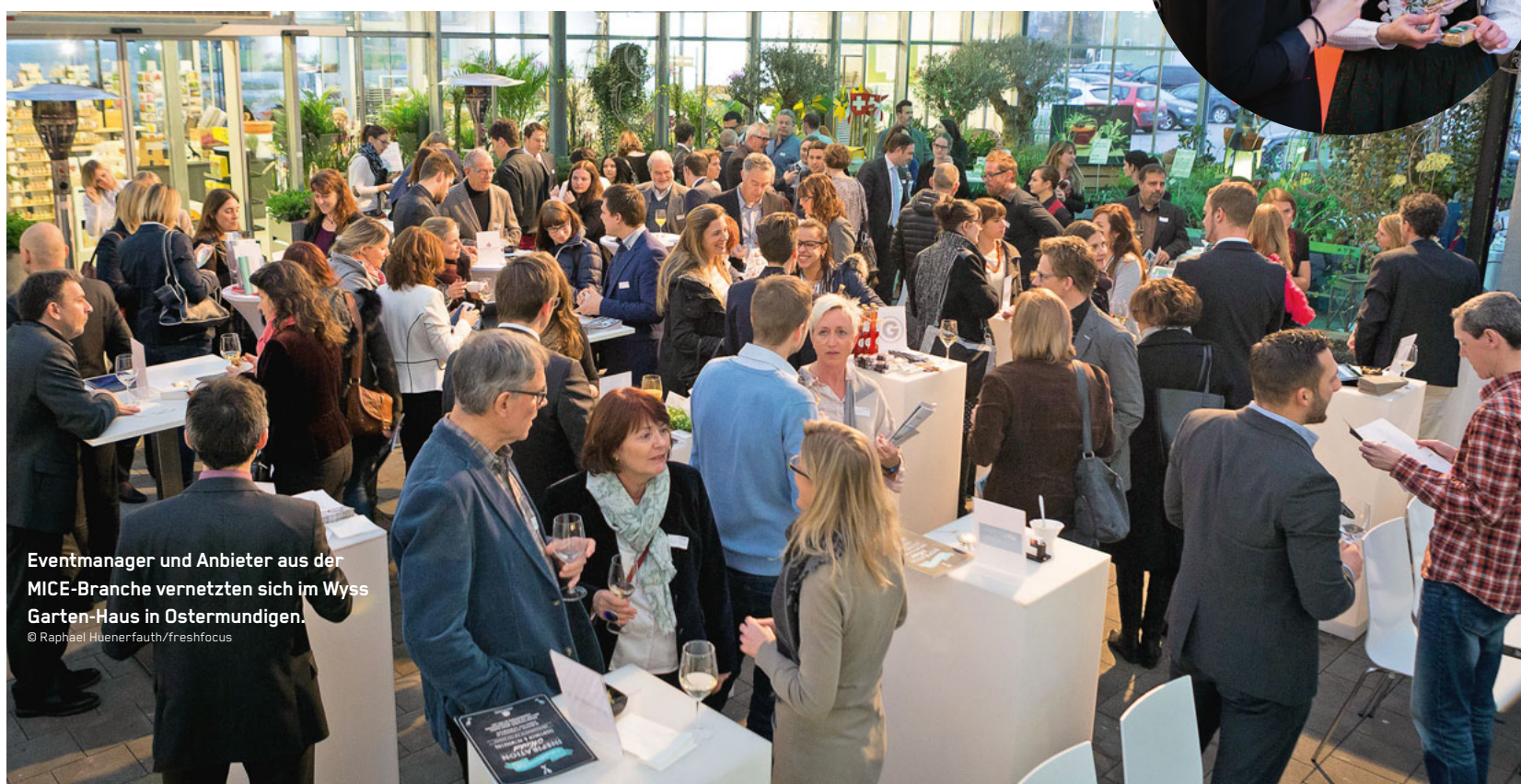
Eventmanager und Anbieter aus der MICE-Branche vernetzten sich im Wyss Garten-Haus in Ostermündigen.